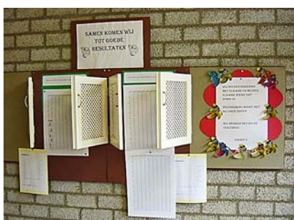
Een databord in groep 5

en afgesproken wat er moest gebeuren, wat de gedrag- en samenwerkingsregels zouden zijn en hoe ze het zouden aanpakken.