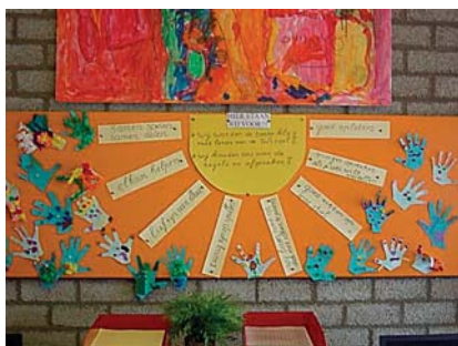
Missie en regels binnen een klas

Een training in één dag, waarbij geleerd wordt hoe je stap voor stap heel praktisch kunt werken aan betere opbrengsten.